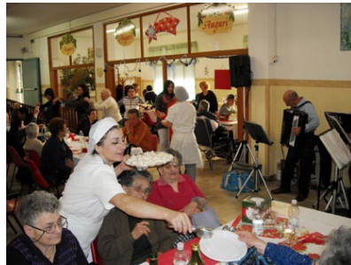
■ Una festa bella e partecipata, come ogni anno, più di ogni anno perché fatta con il cuore. Dai primi di dicembre sino all'Epifania, la casa di riposo "Ciriaco Mordini" ha vissuto giornate

to: furti, lancio di sassi, rottura di vasi, aiuole e quant'altro, oltre che per gli incidenti stradali. «Il nostro Comune è stato il primo dell'area-sud ad aderire a questo progetto assumendo, rispetto alle tradizionali misure di prevenzione, un ruolo attivo e propositivo in ambito di sicurezza pubblica creando un sistema integrato con le altre forze dell'ordine: la validità riscontrata ci sta portando a valutare la possibilità di estendere l'installazione delle telecamere intelligenti ad altri siti delicati del territorio», annuncia l'assessore Russo.