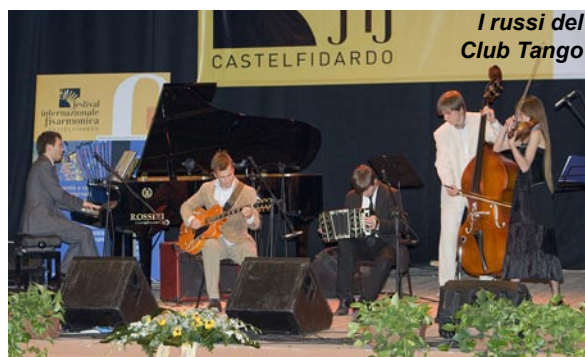
I russi del Club Tango