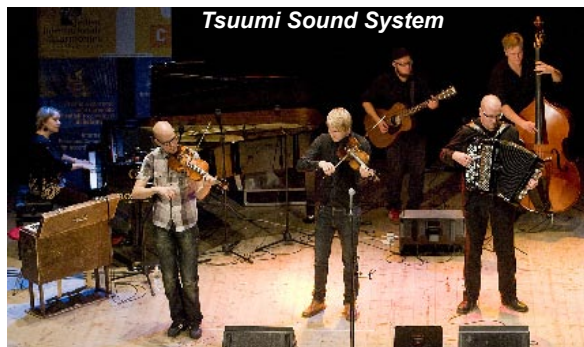
Tsuumi Sound System