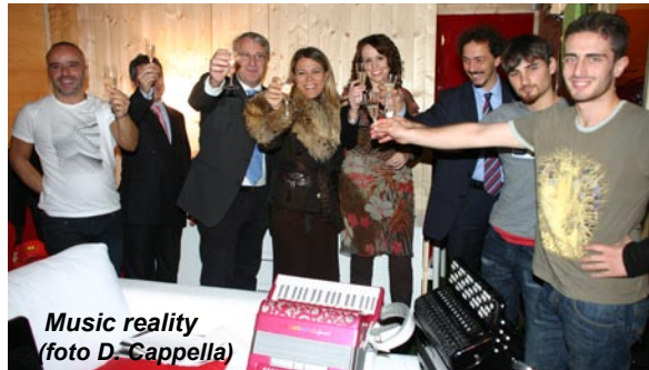
Music reality