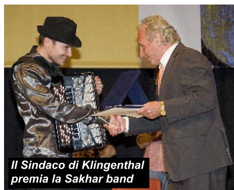
Il Sindaco di Klingenthal premia la Sakhar band