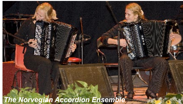
The Norwegian Accordion Ensemble