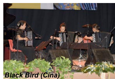
Black Bird (Cina)