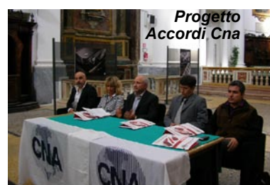
Progetto Accordi Cna